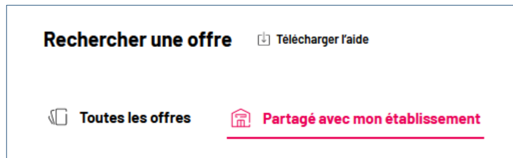
Capture d'écran d'ADAGE, onglet « Partagé avec mon établissement » permettant d'accéder aux offres ciblées.

Si une offre collective a été co-construite en partenariat avec un établissement scolaire, l'acteur culturel peut l'adresser à ce collège ou lycée : l'offre est consultable et pré-réservable uniquement par les personnels de cet établissement, qui ont alors accès à un onglet dédié sur ADAGE.