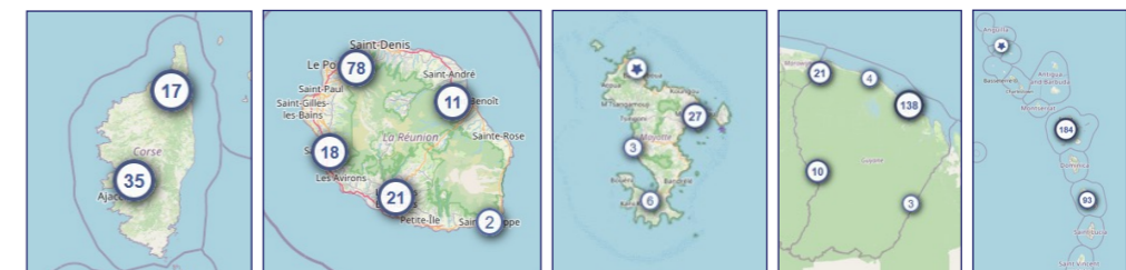
Affichages de la cartographie des partenaires culturels sur ADAGE en zoom large. Les professeurs peuvent centrer la cartographie sur leurs établissements scolaires, 02/08/2022.